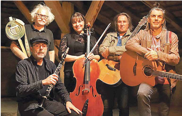
„Woody's Machine“ sind im Gemeinschaftsraum Judendorf zu Gast.

dessen Todestag sich heuer zum 50. Mal jährt. Guthrie, der als einer der bedeutendsten Singer/Songwriter aller Zeiten gilt, wurde vor allem durch seine gesellschaftskritischen Lieder bekannt, die auch von Künstlern wie Bob Dylan, Pete Seeger, Joan Baez, Bruce Springsteen und Billy Bragg interpretiert wurden.